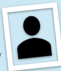
Kokken bag: Klima Madkokkesen

Med venlig hilsen Chef Vil Bestemmesen Adm. Direktør Coop.mad.dk