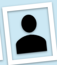
Ernæringsseksperten bag: Protein Skaldespisen