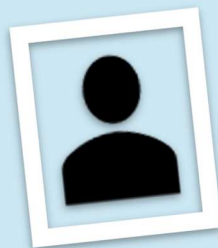
Klimaeksperten bag: Klima Skalvi Passepåsen